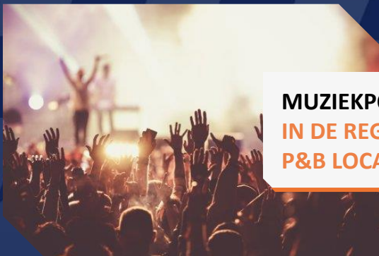
MUZIEKPODIA IN DE REGIO BIJ P&R EN P&B LOCATIES