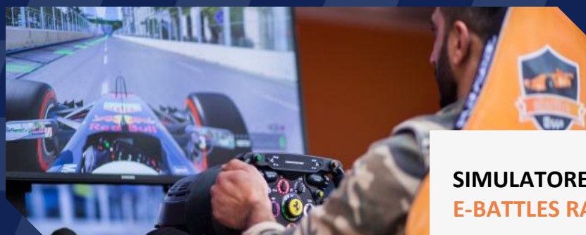
SIMULATOREN & E-BATTLES RACES